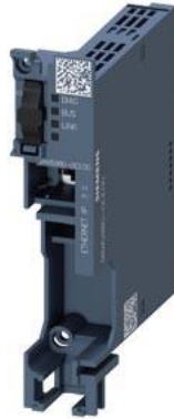
Módulo de comunicación EtherNet/IP