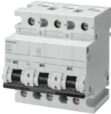
Automático magnetotérmico 400V 10kA, 3 polos, C, 80A, T=70 mm