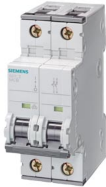
Automático magnetotérmico 400V 10kA, 2 polos, C, 50 A, T=70 mm