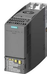
Figura similar Figure similar

Referencia : 6SL3210-1KE18-8UB1 Article No. :