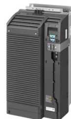
Figura similar Figure similar