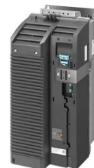
Figura similar Figure similar