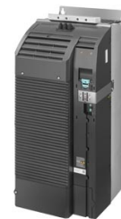
Figura similar Figure similar

Referencia : 6SL3210-1PE32-5UL0 Article No. :