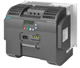
Figura similar Figure similar

Referencia : 6SL3210-5BE31-1UV0 Article No. :