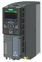
Figura similar Figure similar

Referencia : 6SL3220-3YC14-0UF0 Article No. :