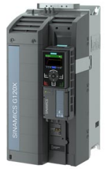
Figura similar Figure similar

Referencia : 6SL3220-3YE34-0UF0 Article No. :