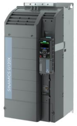
Figura similar Figure similar

Referencia : 6SL3220-3YE44-0UF0 Article No. :