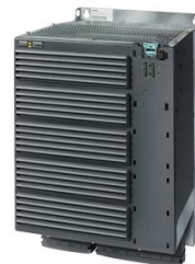
Figura similar Figure similar

Referencia : 6SL3225-0BE37-5UA0 Article No. :